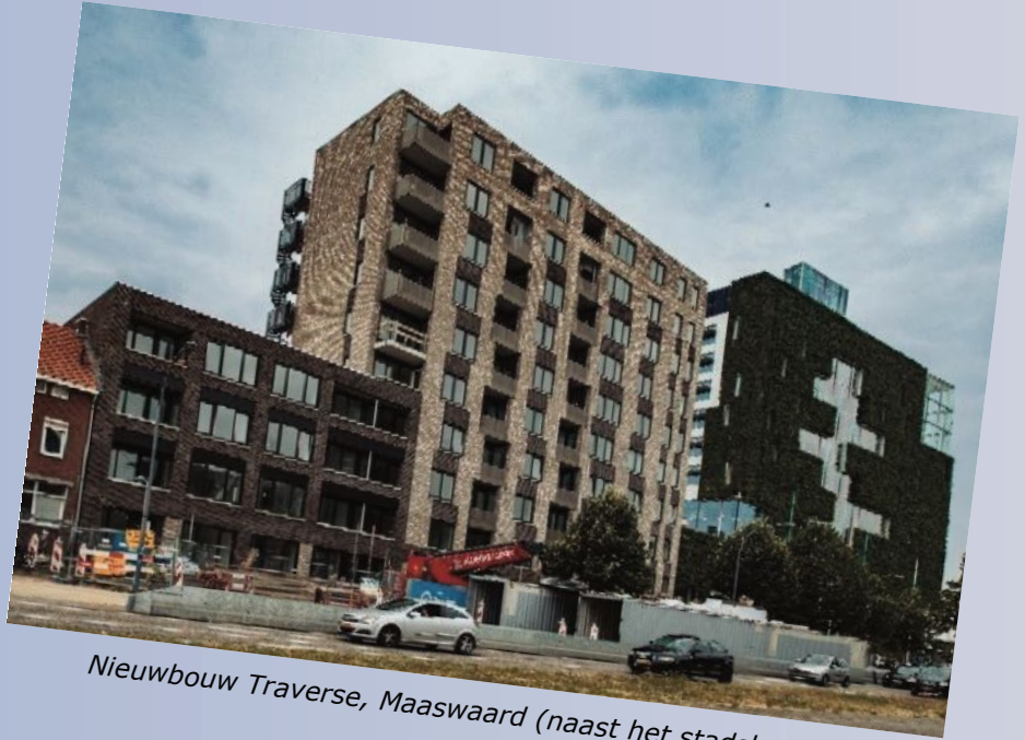
Nieuwbouw Traverse, Maaswaard (naast het stadskantoor)