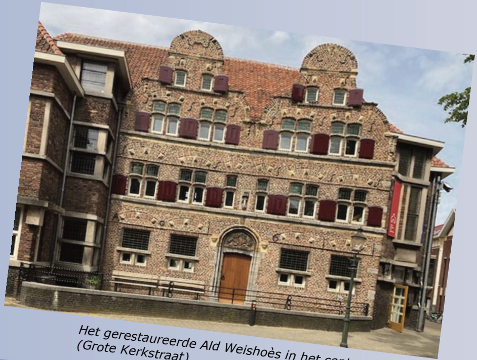
Het gerestaureerde Ald Weishoës in het centrum van Venlo (Grote Kerkstraat)